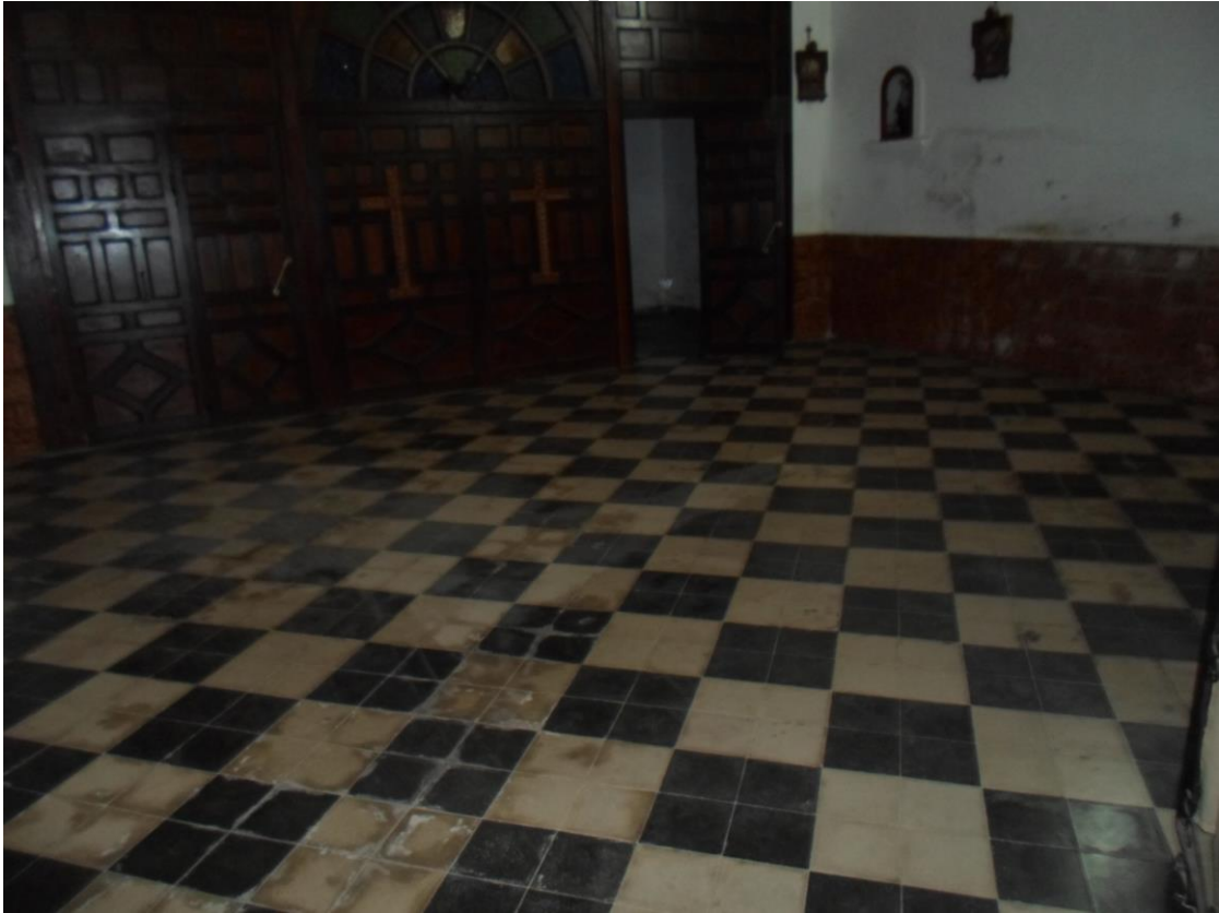
La losa de la Iglesia muy desgastada desde sus inicios y atacada por la humedad...