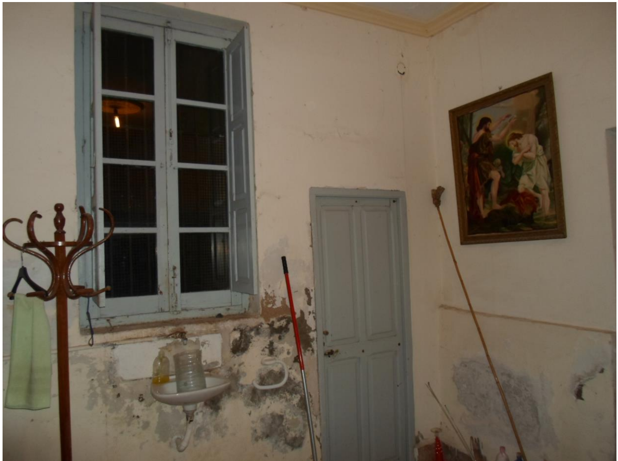
Humedades en la sacristía de la Iglesia san José de Al Hoceima