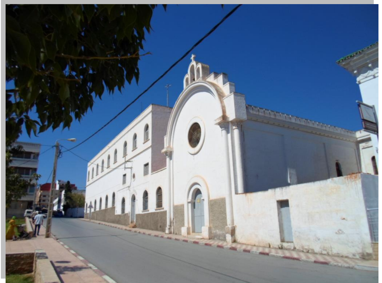
Iglesia san José de Al Hoceima con el Convento