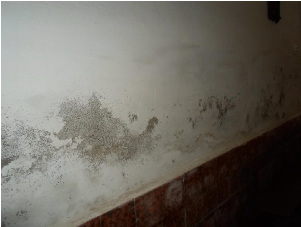
Humedades presentes hasta la altura de dos metros , presentes en todas las paredes