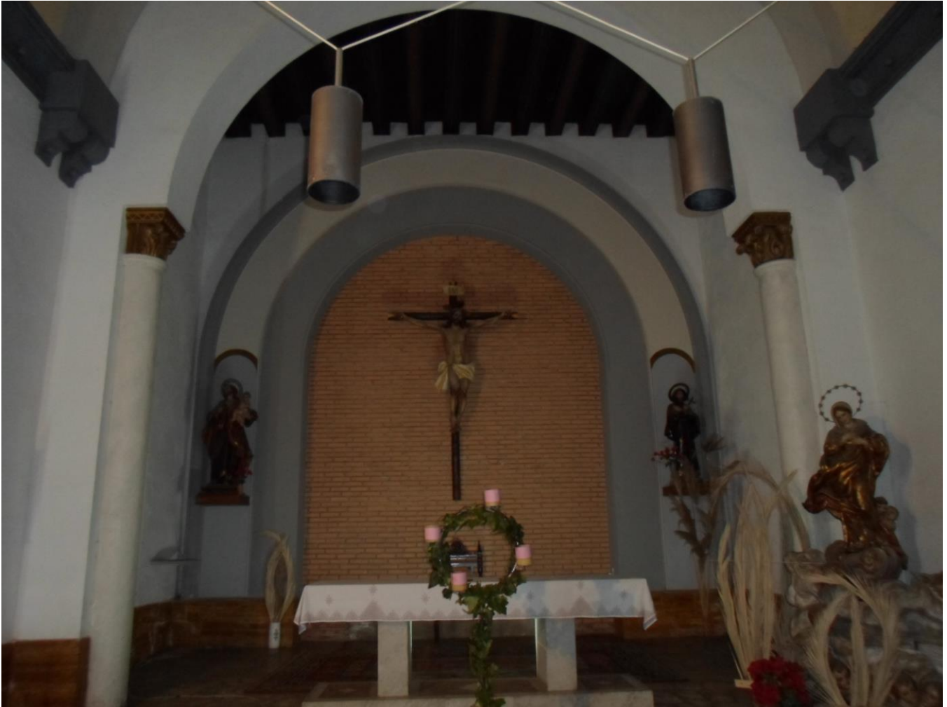
Altar Principal y altares laterales...