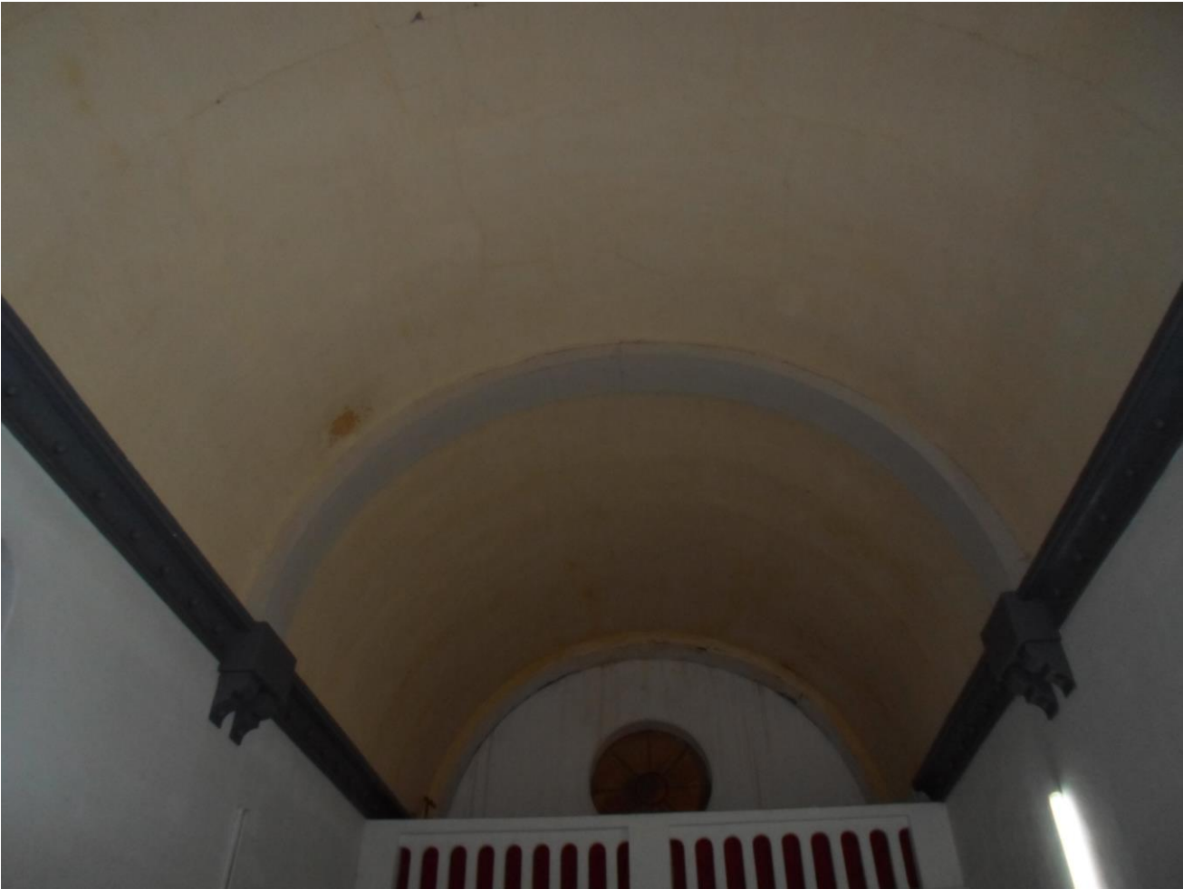
Goteras y fisuras en el techo principal